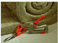
Schere und Tacker zur Verarbeitung von Alchimea lana