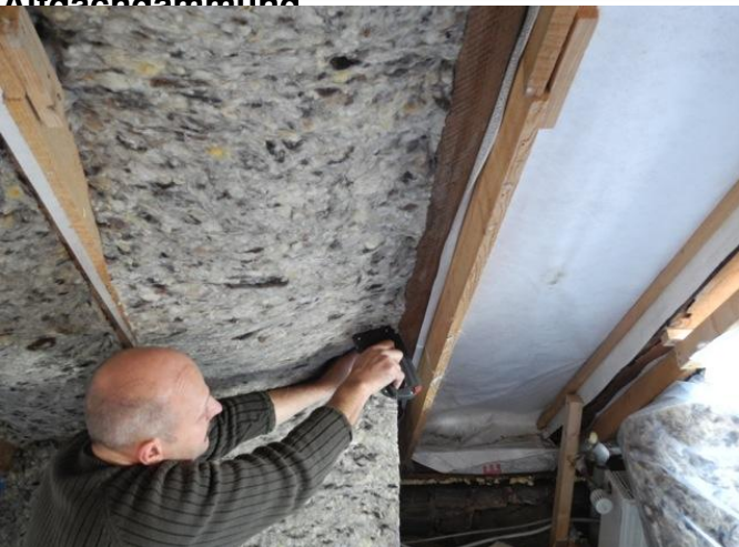
Unterspannbau, Dampfbremse und Anschlusskeller