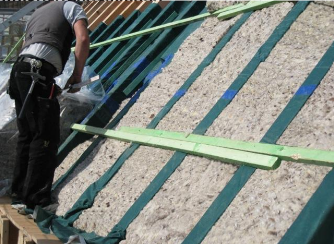
Unterdeckbahn, die in Alchimea, Naturdämmung, Konterlattung, Dacheindeckung, Dachlattung, nachträgliche Konterlattung/Hinterlüftung, Unterdeckbahn (dampfdiffusionsoffen), Alchimea lana, seitliche Bohlenlasche, Dampfbremspapier, Konterlattung, Innenverkleidung (hier Gipskarton)